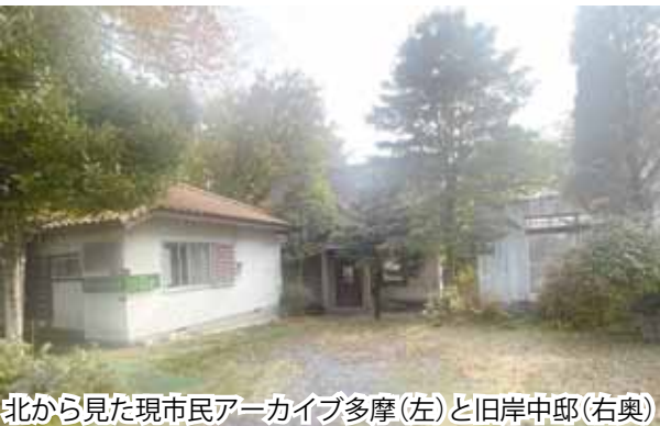
北から見た現市民アーカイブ多摩(左)と旧岸中邸(右奥)

旧岸中邸は住居として、最近ではカフェとして使用されてきた建物であり、また下水道が立川市に譲渡される敷地内にあるため、下水道の付け替え工事と内装を一部変更する必要があります。