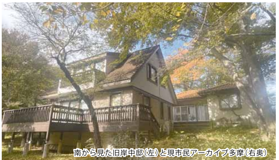
南から見た旧岸中邸(左)と現市民アーカイブ多摩(右奥)

現在、移転作業は開館日を利用して、当会運営委員や当番、ボランティア数人が担っています。「若い」とは言い難いメンバーばかりですが、限られた時間や人数の中で、精力的に移転作業に勤しんでいます。もしお